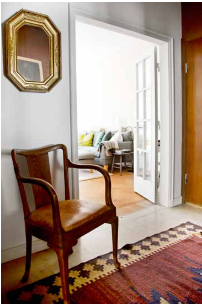
KVALITET SOM HÅLLER. I hallen står en vacker karmstol i ek från förra sekelskiftet inköpt secondhand på 1970-talet.