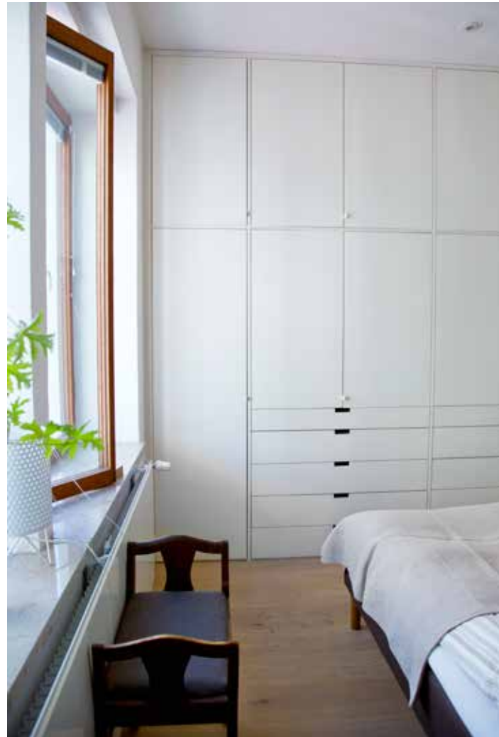
REJÄLT MED FÖRVARING. Sovrummet bytte plats med det tidigare köket och fick en garderobsvägg av en prototyp i Norrgavels produktutveckling.