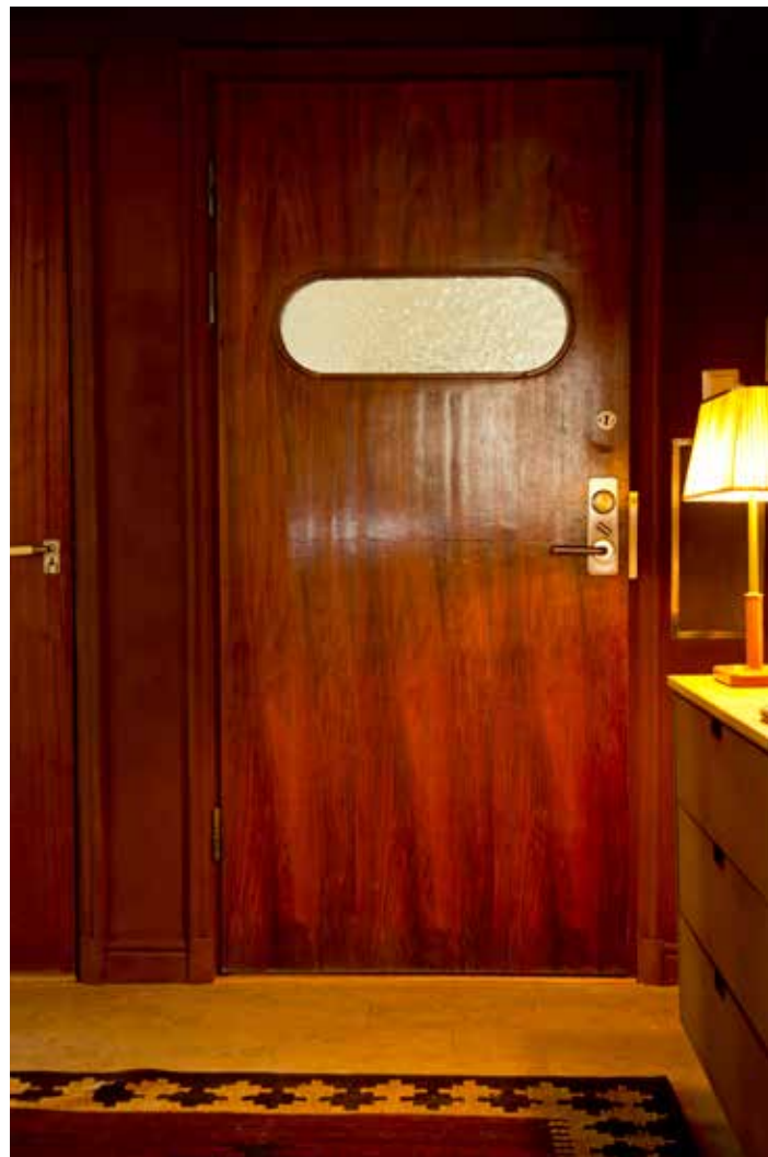
VACKER ENTRÉ. Ytterdörren i maghogny har ett ovalt fönster i frostat glas som släpper in eftermiddagssol från trapphuset.