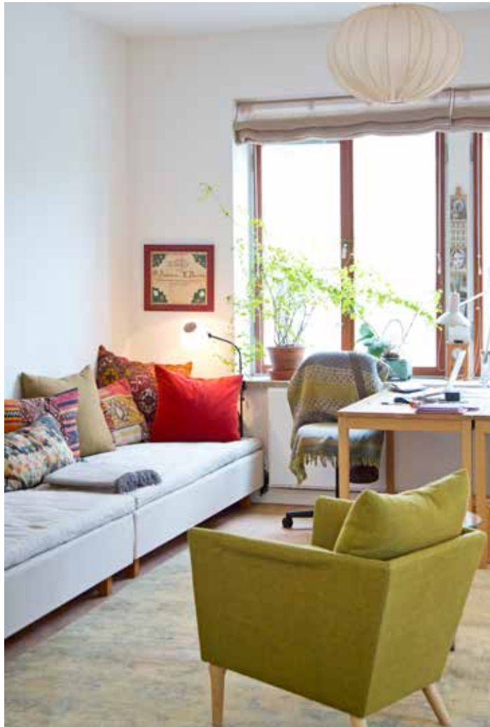
FUNKTIONELLT. Arpita som är terapeut tar emot klienter i arbetsrummet. Hennes kontorsstol har kamouflerats med en vacker filt så att den lättare smälter in i rummets estetik.