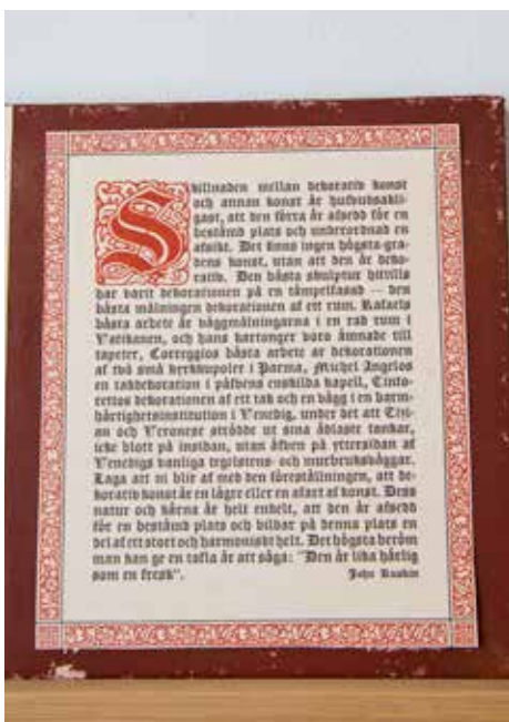
KONSTHISTORIA. Ett provtryck från 1913 om skillnaden mellan konst och formgivning av den engelske konstkritikern och författaren John Ruskin, en gåva från en nära vän.

► Framför de franska balkongdörrarna finns det gott om plats att utöva yoga. De har regelbundet meditationsträffar i rummet, då flyttar de ut möblerna till köket på mindre än tio minuter. Meditationskuddar och en Buddhastaty skänker rummet en sakral känsla.