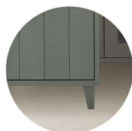
Ben Kil i björk*