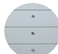
Släta lådor - välj bland ca 80 olika knoppar & handtag