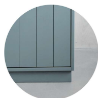
Sockel i björk*