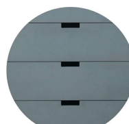
Lådor med urtag