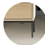
Benställning i metall Välj till H2, H3 & H4