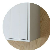
Vägghängd Välj till H2, H3 & H4