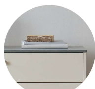
Kalksten Välj till M1 & M2