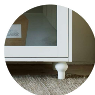
Ben Svarvat i björk eller ek**