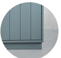
Sockel i björk*

Välj bland ca 80 olika knoppar & handtag