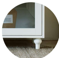
Ben Svarvat i björk eller ek**