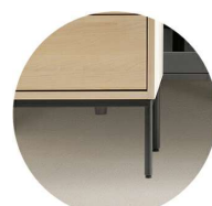
Benställning i metall Välj till H2, H3 & H4