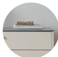
Kalksten Välj till M1 & M2