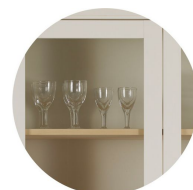
Glaslucka klart glas Välj till H3 & H4 (H2 frostat glas)