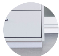
Sockel i lack

Alla avslut förutom hjul kommer med nivåreglering.