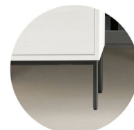
Benställning i metall

* Ytbehandlas med såpa, olja eller vitolja