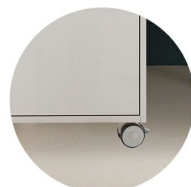
Hjul ø75 mm Välj till H2 & H3