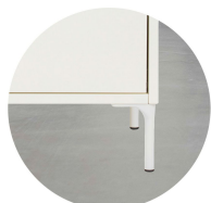
Ben Gracil Välj till M1 & M2