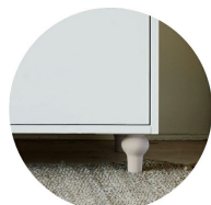
Ben Svarvat i björk eller ek*